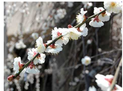
白梅：高潔、忠実、忍耐

八千代心身障害児者父母の会(ひよこの会)は、NPO法人にじと風福祉会の活動を全面的に応援しています