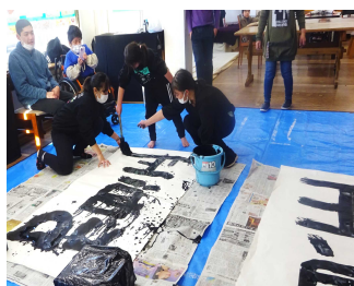
リレーかきぞめ「賀正」