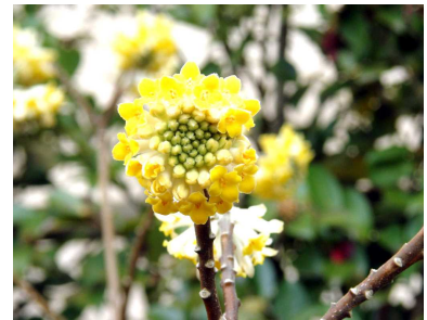
三椏(ミツマタ)：強靱、壮健、肉親の絆

八千代心身障害児者父母の会 (ひよこの会)は、 NPO法人にじと風福社会 の活動を全面的に 応援しています