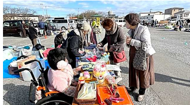
1/7(日)の福祉バザール