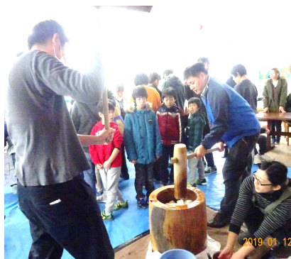
津田・小茂田さんが交代で捏ねどりを