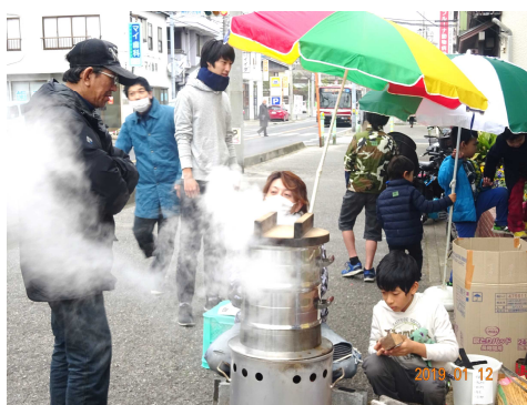
霧雨の中寒さに耐えました