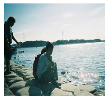
ゆっくり沼を眺めています

11月3日(土)文化の日 公園に行ってきました。 晴れてはいましたが、と ても寒かった日でした。 しかし、寒さはなんのそ の、元気に走りまわって、 身体はすぐに温まりました。