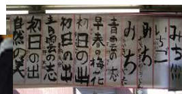
力強い作品が並びました

1月5日(土)、お天気に恵まれた中で、毎年恒例のお餅 ちつきをしました。ボランティアの方も来て下さり、 つきたての美味しいお餅が沢山出来ました。 保護者の方が調理をして下さり、子ども達と美味しい 時間!!を過ごしました。30KGをペロリ 今年も皆様のご協力のお陰で無事開催できました。 その後、子ども達の今、感じていることを書初めに 託しました。