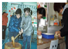
一緒にベッタン きな粉です