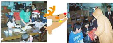
協力して作ります

みんなが楽しみにしていたクリスマス会。 自分達で作ったデコレーション盛り盛りのXmas ケーキを食べた後、サンタさんとトナカイから プレゼントをもらって大喜びの子ども達でした。