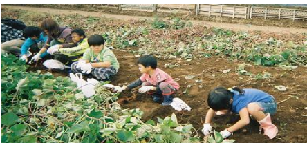
一生懸命に掘っています

10月19日・20日の二日間、八千代市ドーンと祭りがありました。保護者の方が手伝いをしてくださっているなか、さつまいも掘りへ行ってきました。子ども達の顔よりより大きなお芋を、職員に自慢気に見せていたり、スーパーボールのように小さなお芋を優しく自分の袋へ入れている子。取ってきたお芋を使って、ジャックオーランタンの顔を作りました。