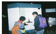
きぼーるの科学館へ。様々な機械があり、興味深々です。