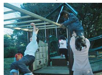
ホイホイホイっと