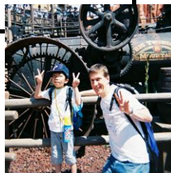
ボランティアさんとパシャリ!