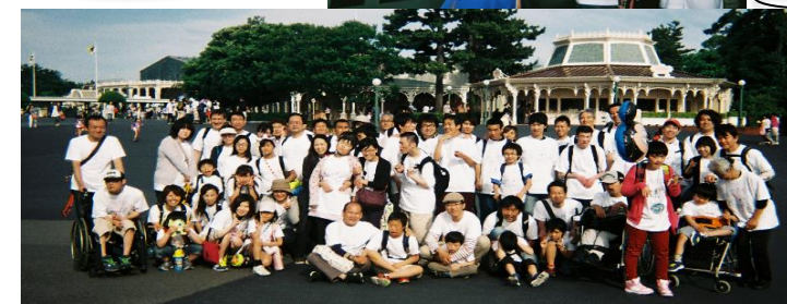
みんなで集合写真!!