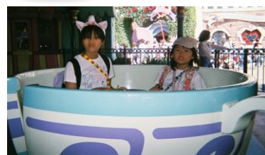
ちょっとよそゆき。にじ風のお姫様